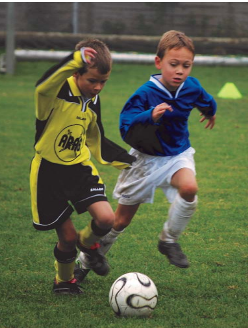
Packende Zweikämpfe beim Turnier in Waldperlach

Am Samstag hieß es früh aufstehen, denn Anpfiff zum ersten Spiel beim SV Waldperlach war bereits um 9:00 Uhr. Auch zu diesem Turnier waren wir wieder mit alle Mann (seit kurzem auch Frau), die verfügbar waren, dabei. Damit konnten wir auf eine starke Ersatzbank blicken.