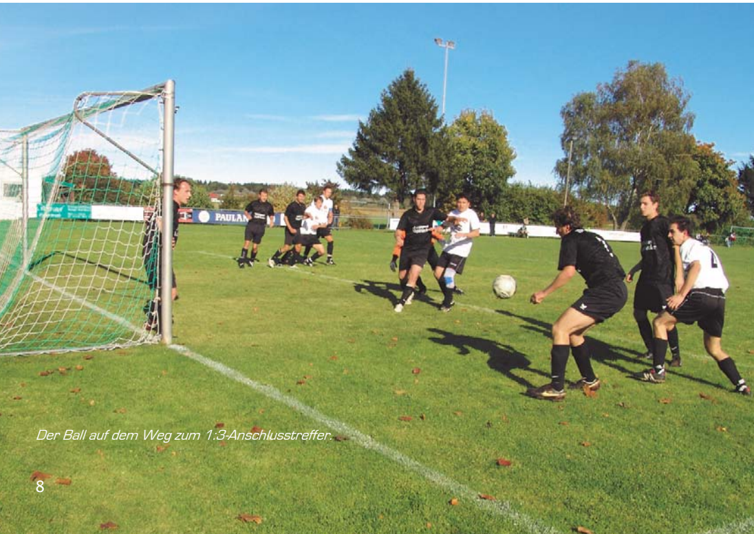
Der Ball auf dem Weg zum 1:3-Anschlusstreffer.

Tore: 0:1 / 0:2 / 0:3 Gegentore, 1:3 Kandler, 2:3 Schumann, 2:4 Gegotor.