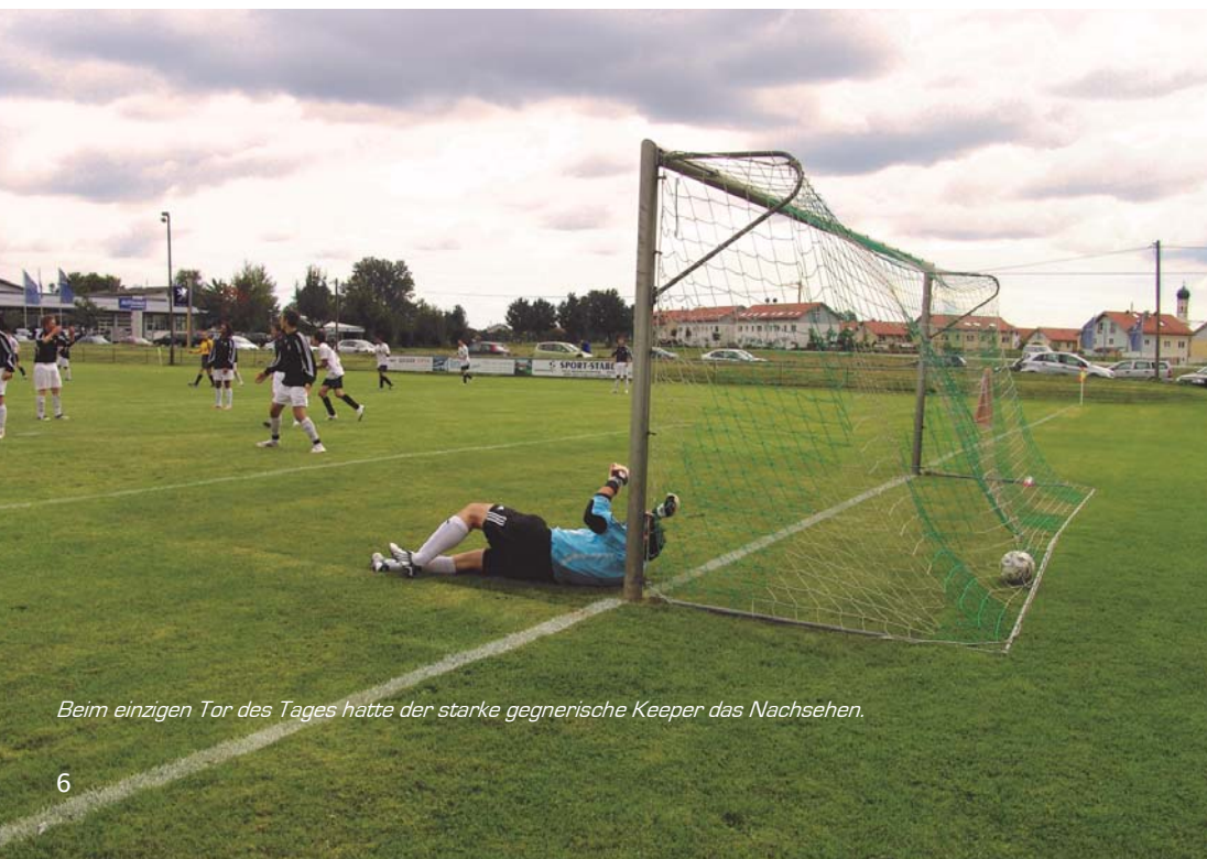
Beim einzigen Tor des Tages hatte der starke gegnerische Keeper das Nachsehen.