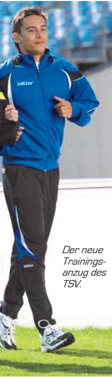
Der neue Trainingsanzug des TSV.

Zukünftig wollen wir alle mit einer neuer Sportbekleidung ein einheitliches Erscheinungsbild ermöglichen. Daher wurde ein neue Kollektion gesucht und eine qualitativ hochwertige sowie preislich attraktive Ausstattung bei Sport-Saller gefunden. Gleichzeitig steigen wir auf die frischen Farben blau/schwarz/weiß um. Die neue Linie „ Evolution “ ist für die nächste Jahre bestellbar. Es gibt folgende Kombinationen und Einzelteile: