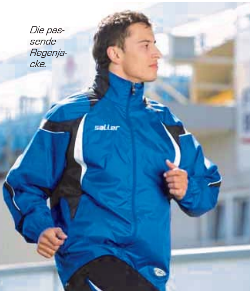
Die passende Regenjacke.

Bei Abnahme von 50 Stück gibt es das Set für nur 45 Euro. Daher plant die Abteilung eine erste Sammelbestellung bis Mitte Oktober. Die Trainer informieren hierüber alle Teams. Zum Preis kommen noch die Beflockungskosten in Höhe von etwa 4 Euro hinzu.