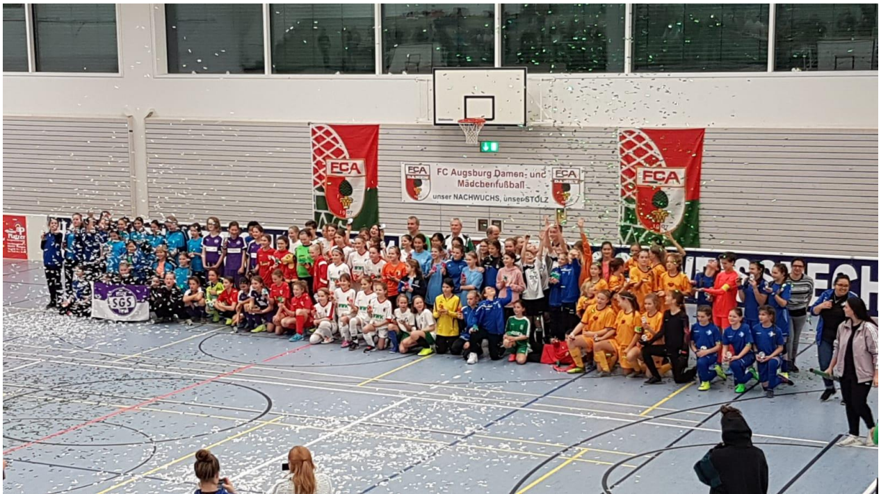
Turnier beim FC Augsburg

Um bei den nächsten Spielen wieder voll angreifen zu können, bieten wir mit Hilfe der Zoom-App zwei Mal in der Woche ein WorkOut für die Mädels an. So bleiben wir weiterhin in Kontakt und fördern die Fitness unserer Mädels.