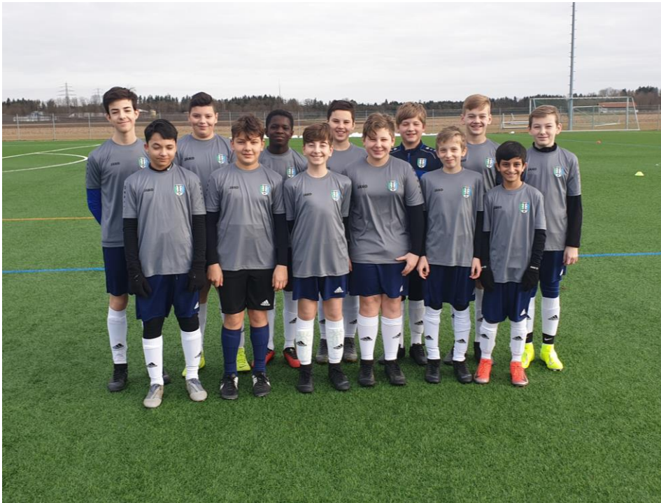
D1 Jugend – gelungener Auftakt, dann Stillstand

In der Rückrunde der Saison 2019/2020 hatten wir viel vor, die positiven Lichtblicke der Hinrunde wollten wir herausnehmen und an den Schwächen arbeiten, um für die neue Saison auf dem Großfeld gerüstet zu sein. Nach der endlich mal erfolgreichen Hallensaison begannen wir früh mit der Vorbereitung der Rückrunde.