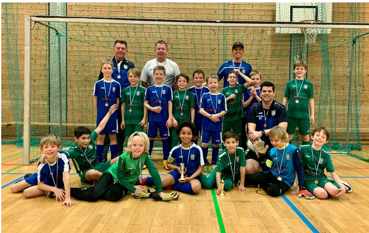
Die erfolgreichen Teams Blau und Grün bei unserem Heimturnier

Team Blau war im Spiel gegen SV Olympiadorf München eigentlich Außenseiter. Dank einer unglaublich kämpferischen Team-Leistung reichte es aber tatsächlich für die große Überraschung (1:0). In den Platzierungsspielen konnte sich Team Grün am Ende den verdienten 3. Platz sichern. Team Blau verlor das Finale sehr klar mit 8:0 gegen den TSV Milbertshofen. Das schadete aber keinesfalls der tollen Gesamtleistung des TSV Hohenbrunn mit zwei Podiums-Plätzen beim Heimturnier.