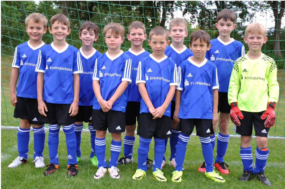
F2 Jugend - Frühling 2017, was für eine Saison!

In unserer Frühlingsaison 2017 haben wir wieder viel gelernt. Auch wenn der Start etwas holperig war (1:9 gegen TSV Grafing 3) haben wir eine ordentliche Saison hingelegt, auf die die Kinder wirklich stolz sein können. Ohne sich von der Niederlage runter ziehen zu lassen, haben wir gegen SV DJK Taufkirchen, Waldperlach und Feldkirchen tolle Spiele gemacht. Auch gegen Zorneding konnten wir wieder einen Sieg verbuchen, auch wenn uns der Trainer einen harten Kampf angekündigt hat - natürlich immer mit einem Augenzwinkern, schließlich spielen wir in der Fairplay Liga, in der es vor allem um Freude am Spiel und Spaß geht.