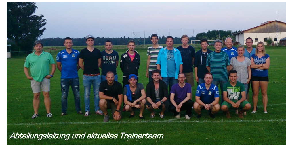
Abteilungsleitung und aktuelles Trainerteam