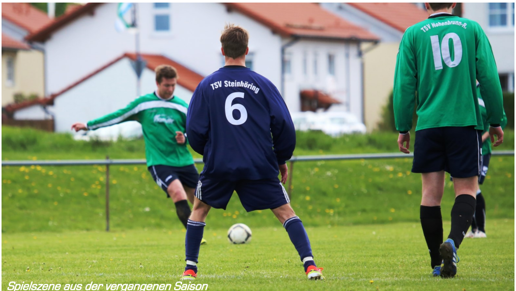
Spielezene aus der vergangenen Saison

Die ersten Spiele der Vorbereitung sind absolviert. Der Start verlief sehr erfolgreich. Gegen die Kreisklassenmannschaft vom SV Warrgau siegte die Erste mit 5:3. Auch der Doppelspieltag gegen den SV Studentenstadt konnten beide Teams erfolgreich gestalten. Die Erste