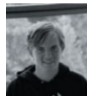
Dominik Busch Web/KICK/ komm. Presse