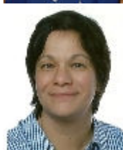
Ines Ernst PR & Sponsoring