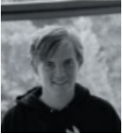
Dominik Busch Web/KICK/ komm. Presse

Die Kontaktdaten zu allen Ansprechpartnern finden Sie unter www.fussball-hohenbrunn.de/wir-ueber-uns/ansprechpartner