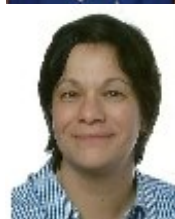
Ines Ernst PR & Sponsoring